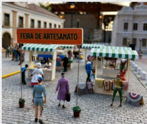
Feira de artesanato na Praça Tomé de Souza faz sucesso e recebe muitas visitas.