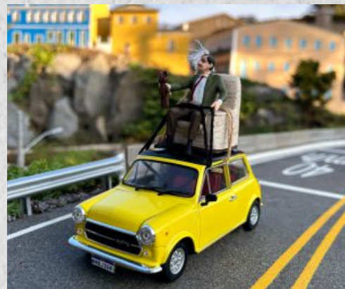
Morador é flagrado dirigindo seu Mini Cooper amarelo de forma inusitada .