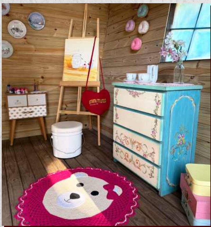
Alguns detalhes só os pequenos podem enxergar...