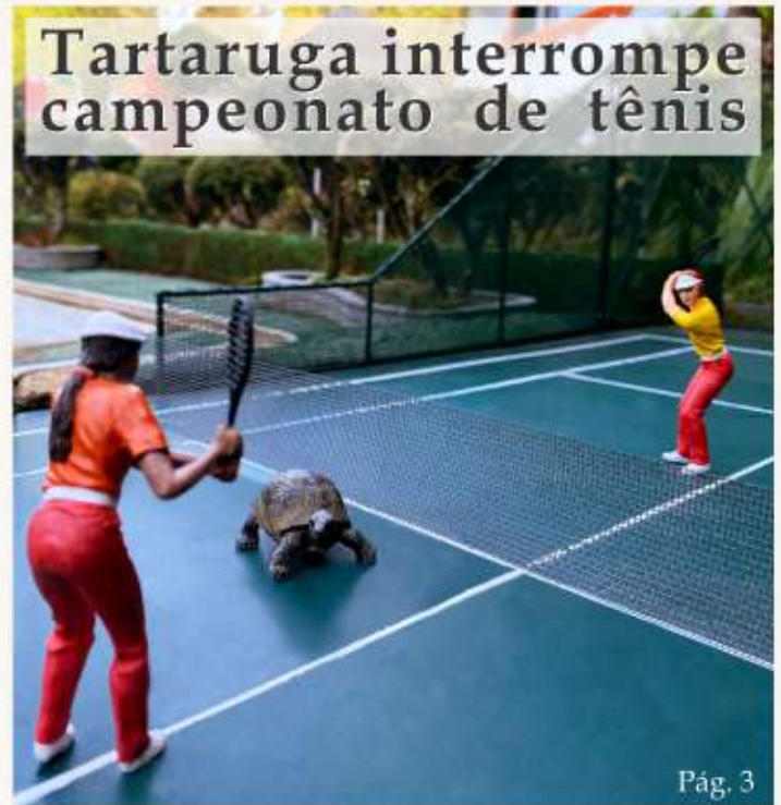
Tartaruga interrompe campeonato de tênis