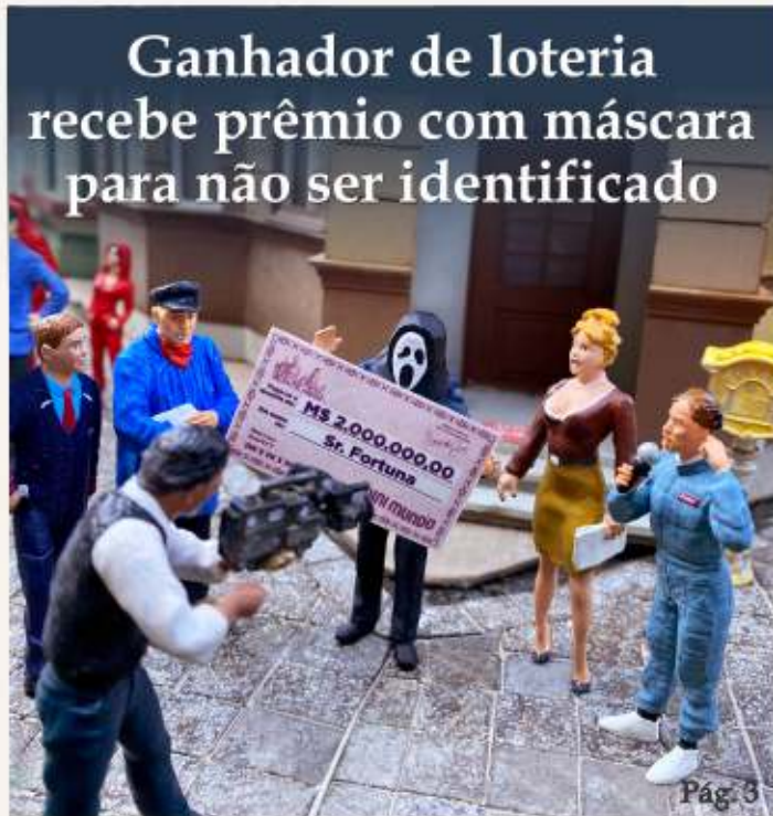
Ganhador de loteria recebe prêmio com máscara para não ser identificado

Publicação do Parque Mini Mundo - Gramado - RS - Ano 13 - Edição 26 - 1º semestre de 2023 - M$1,00