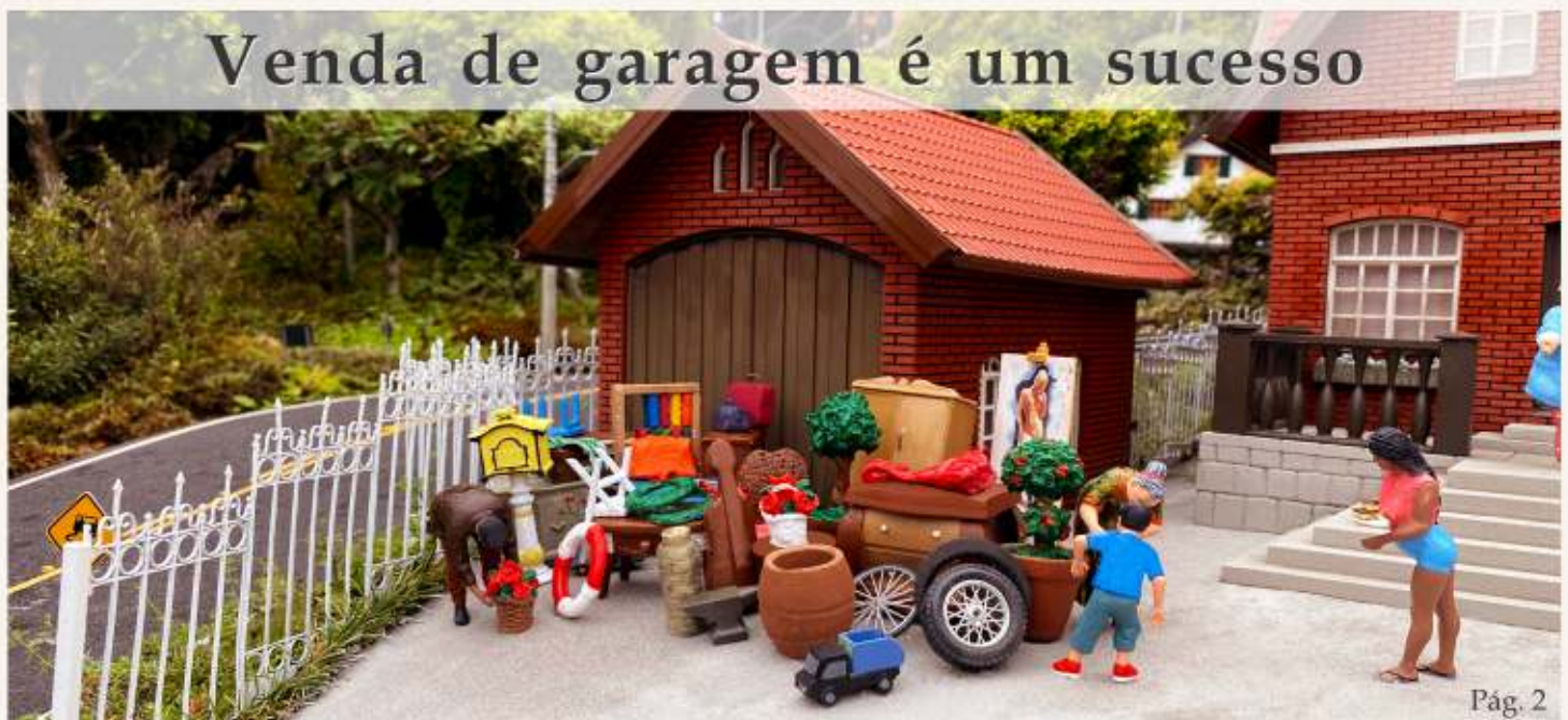
Venda de garagem é um sucesso